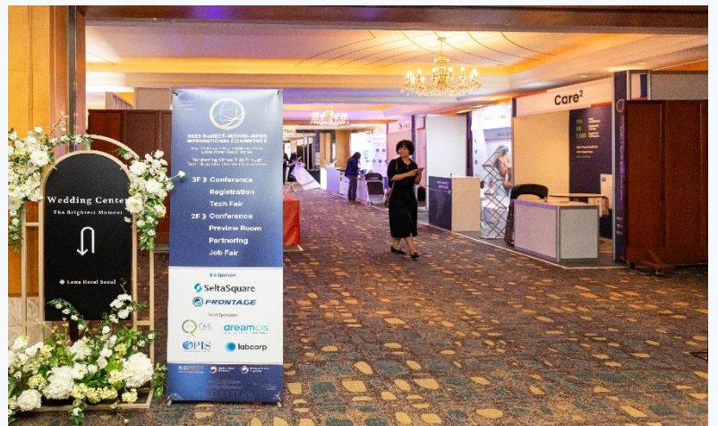
행사장 내부 추가 로고 노출 - 동선배너 (다이아 스폰서, 골드 스폰서)