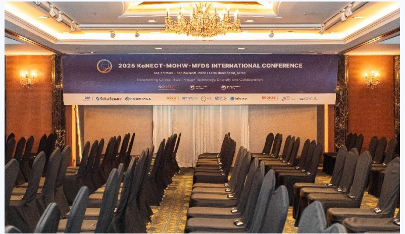
행사장 내부 로고 노출 - 컨퍼런스룸 내부 배너 (모든 스폰서)