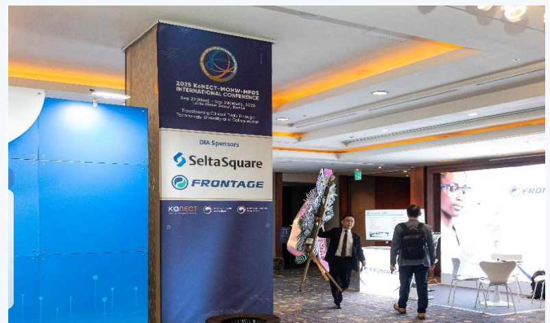
행사장 내부 추가 로고 노출 - 등록데스크, 기동배너 (다이아 스폰서)