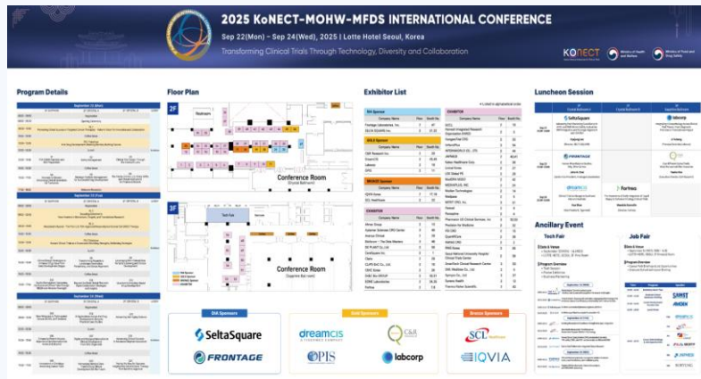
포토월, 아젠다월 로고 노출 (모든 스폰서)